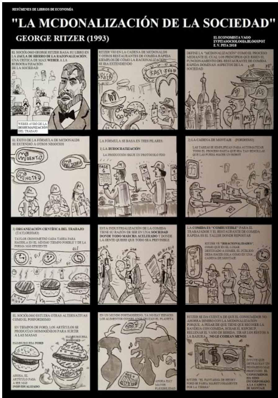
Resumen exprés en cómic de "La McDonalización de la sociedad", de George Ritzer (1993)