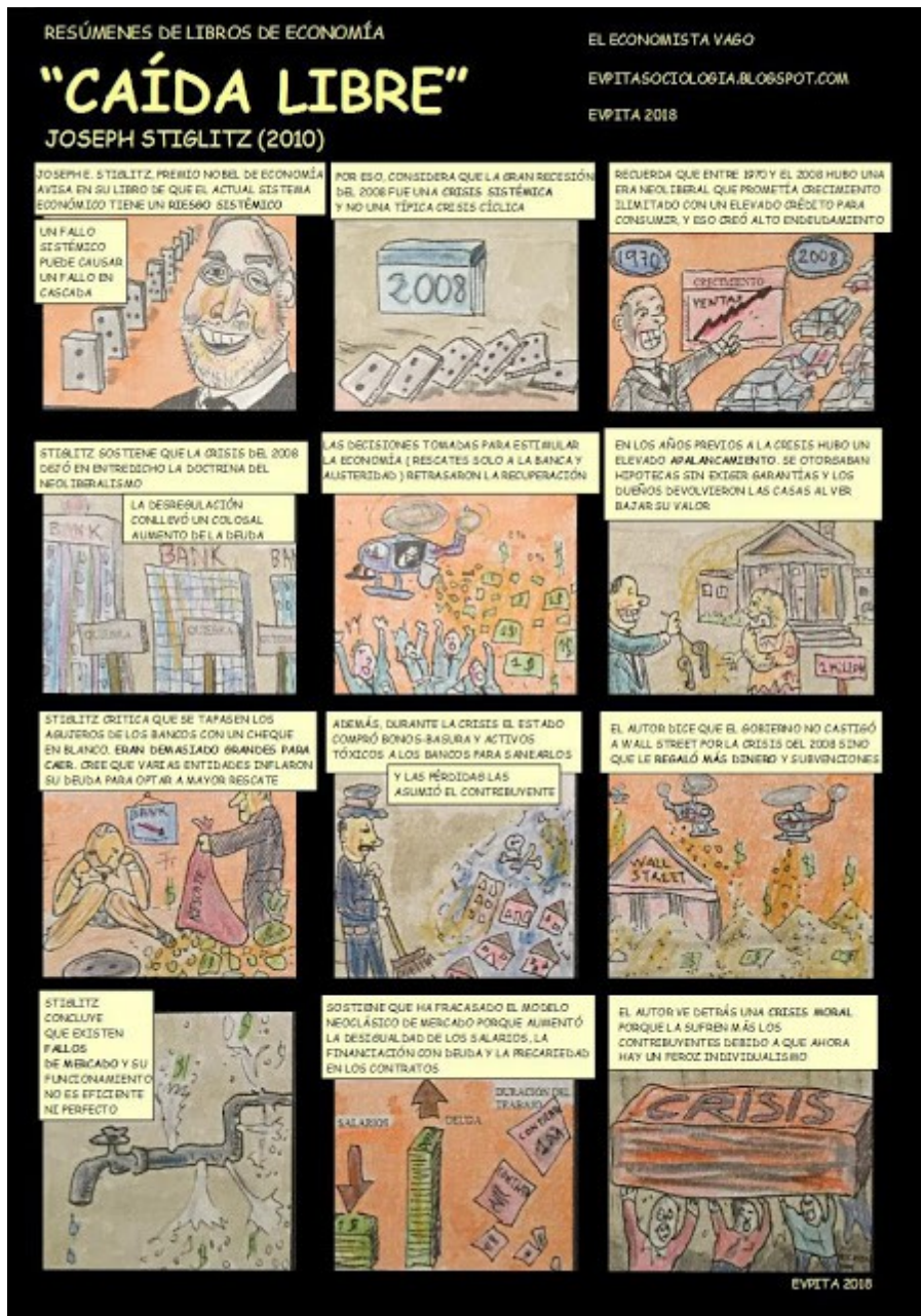
Cómic en color del resumen del libro “Caída libre” de Joseph E. Stiglitz (2010)