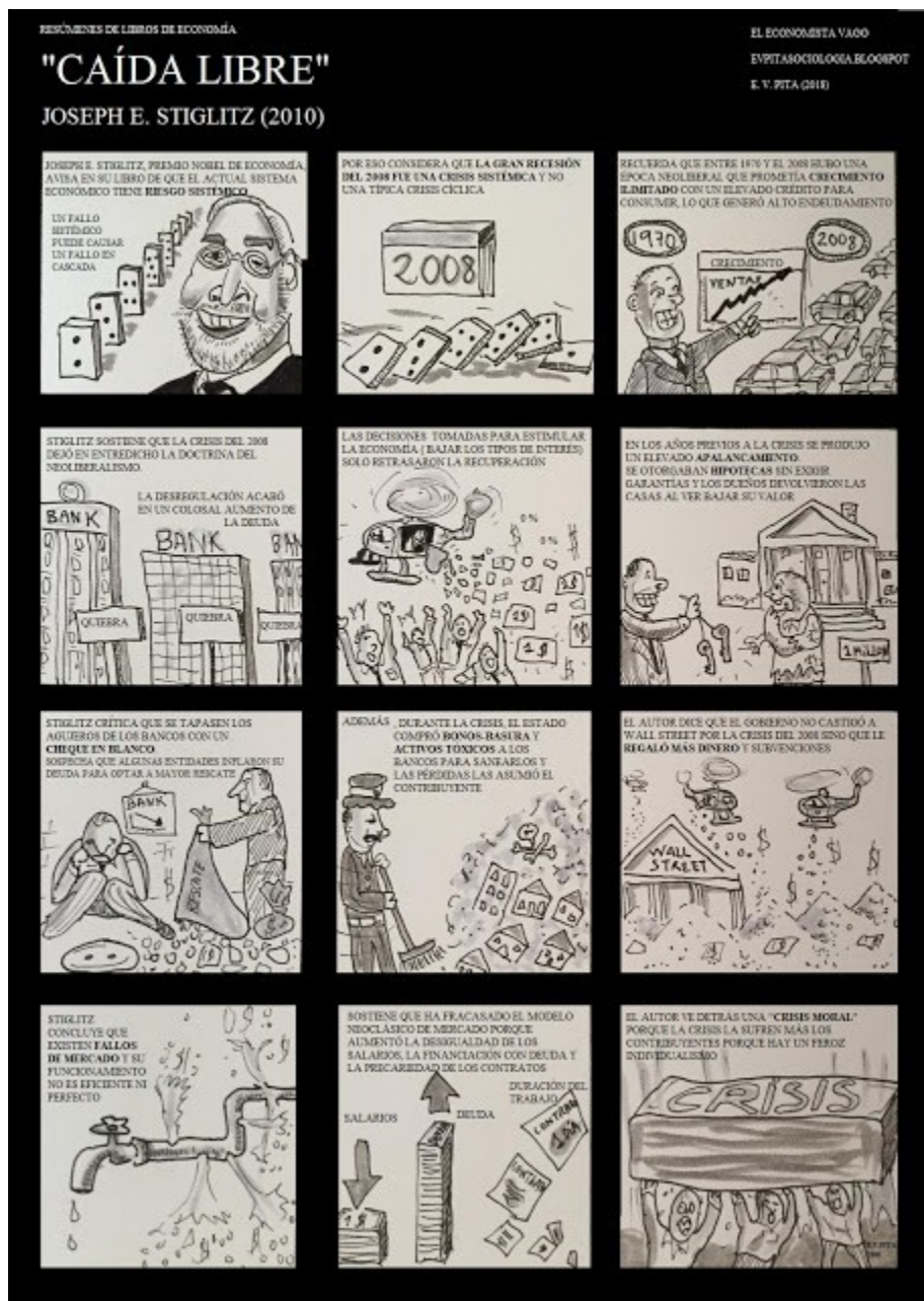
Resumen exprés en cómic de " Caída libre" de Joseph E. Stiglitz (2010)